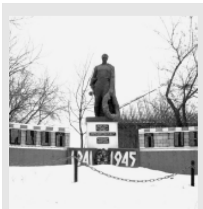
Памятник воинам, погибшим в Великой Отечественной войне. г. Шадрино.