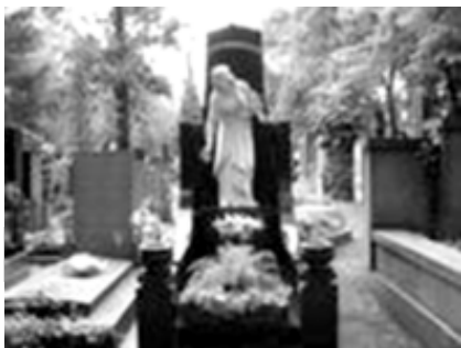
Ольшанское кладбище в Праге.

15 июля 1945 года - 67-й день после Великой Отечественной войны