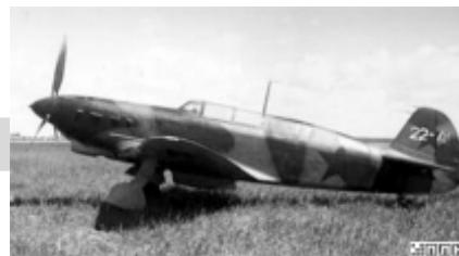
Самолет ЯК-7, Невельский район.

Занимаясь в авиамodelьном кружке, сынок мечтал стать летчиком. Учась в старших классах, занимался в Сарапульском аэроклубе. После окончания десятилетки и аэроклуба был направлен в военно-авиационное училище, которое закончил в феврале 1941 года.