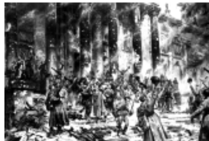
«Победа». Художник П. Кривоногов.

Верховный Главнокомандующий маршал Советского Союза И. Сталин. 9 Мая 1945 года.