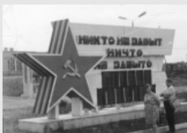
Памятник воинам, погибшим в Великой Отечественной войне, с. Кигбаево.