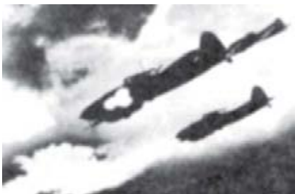
Самолеты ИЛ-2. Июль 1943 г. Фотохроника Великой Отечественной войны.

Курское сражение, он делал в день по пять-семь вылетов.