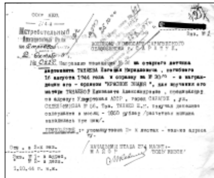
Извещение 274-го истребительного авиаполка от 02.10.1944 (№ 0412).

Фотохроника Великой Отечественной войны.