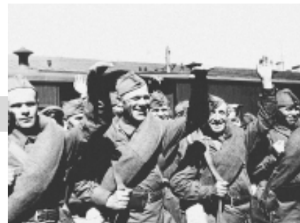
1941 г. Бойцы Красной Армии отправляются на фронт.