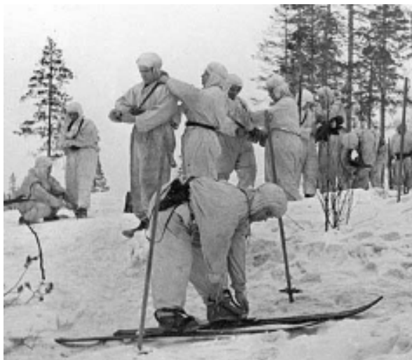
На Карельском фронте.

Гнетнев К. В. Тайны лесной войны: партизанская война в Карелии в воспоминаниях и документах / К. В. Гнетнев. - Петрозаводск, 2008.