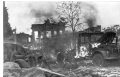
Берлинская операция, 1945 г. Фотохроника Великой Отечественной войны.

9 Мая 1945 года - 1418-й день Великой Отечественной войны