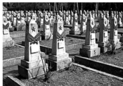
Могилы на Ольшанском кладбище в Праге.