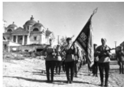
Воины 89-й Белгородско-Харьковской Гвард. СД проходят по ул. Белгорода.

Мурадян В. А. Боевое крещение / В. А. Мурадян. - Москва. 1979.