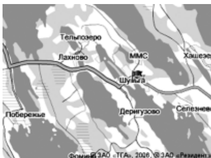
Деревня Шуньга на карте Карелии.