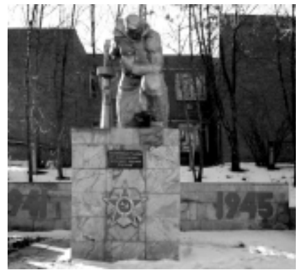
Памятник воинам, погибшим в годы Великой Отечественной войны.