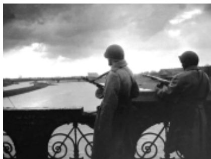
На Одере тишина. Германия.