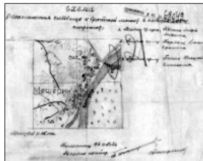
Схема расположения кладбища и братской могилы, в которой похоронены: