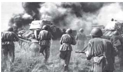
Бой на Курской дуге. Июль 1943 г. Фотохроника Великой Отечественной войны.

О месте захоронения мужа я узнала от следопытов Готнянской средней школы Белгородской области, куда в течение нескольких лет