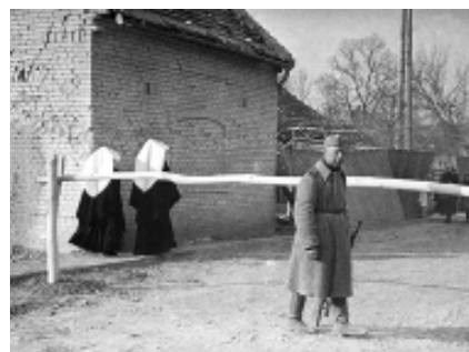
В Чехословакии. 1945 г.

ЦАМО РФ, ф. 58, оп. 18003, г. 1005, л. 17.