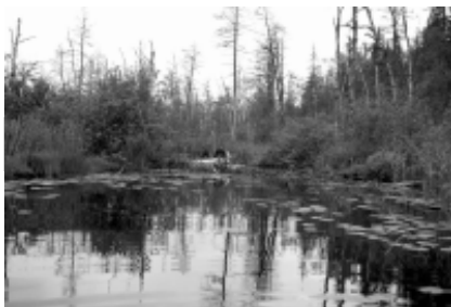
Заонежье. У деревни Шуньга.