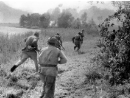
Автоматчики очищают берег озера от немцев на подступах к Восточной Пруссии.