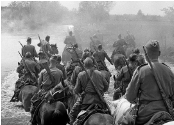
1944 г. Вброд. Переправа кавалерии.

Белов Г. А. Путь мужества и славы / Г. А. Белов. - Уфа, 1985.