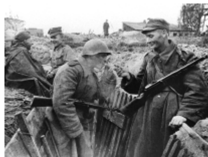
В окопе под Варшавой советские и польские воины. 1945 г.